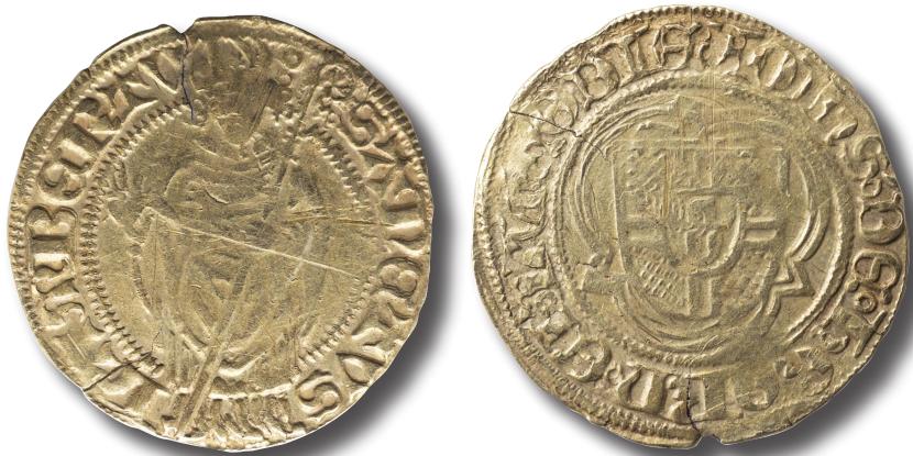
Illustratsioon 3. Viljandist leitud Horni kulden. Viljandimaa Muuseum, VM 10038/N 3198.

teada. 89 Süüdi on siin keskaegse Liivimaa seadusandlus, mis keelas maa- rahvale kullas tasuda. Nimelt tuli kuldmüntide paljususe ja eriilmelisuse juures rohkesti ette talupoegade petmist, mida nõnda püüti ära hoida. 90