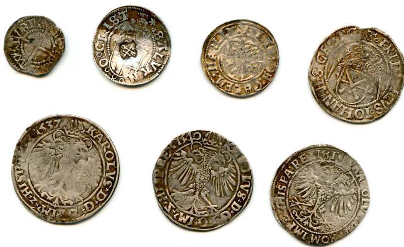
Illustratsioon 5. Eametsa leiu müntid, tpq 1557. Tallinna Ülikooli arheoloogia teaduskogu, AI 8557.

Seletamatul kombel pole ei Eesti ega ka Läti aaretest teada pärandiloendites üsna arvukalt nimetatud schreckenberger 'eid, v.a üks inglükross 2020. aastal Põhja-Pärnumaalt avastatud Eametsa leiust ( tpq 1557). 176 Küll liikus meil aga umbes sama suuri ja raskeid Madalmaade vlieger 'eid, mida aga, vastupidi, pole märgitud pärandiloendites. Juba mainitud Eametsa leius olid koos inglükrossi, paari kohaliku veeringu ja viie killin-giga neli vlieger 'it (vt illustratsioon 5). 177 Koguni 15 vlieger 'it oli Kabala (Pilistvere II) aardes ( tpq 1559), neli (teistel andmetel üheksa) teadmata leiukohaga aardes ( tpq 1556), kaks eksemplari nii Uulu ( tpq 1556) kui ka Kurevere ( tpq 1572) leius ning üks Võnnu I aardes ( tpq 1557). 178 Ka Lätis on vlieger 'eid Liivi sõja eelsetes ja sõja algusaja mündiaaretes üsna sageli ette tulnud. 179 Seda arvesse võttes tundub tõenäoline, et ka vlieger 'eid kutsuti Liivimaal schreckenberger 'iteks.