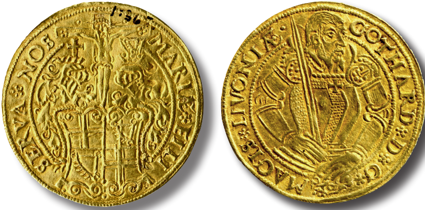
Illustratsioon 2. Haapsalust leitud Gotthard Kettleri topeltkulden. Eesti Ajaloomuuseum, AM 1:365.